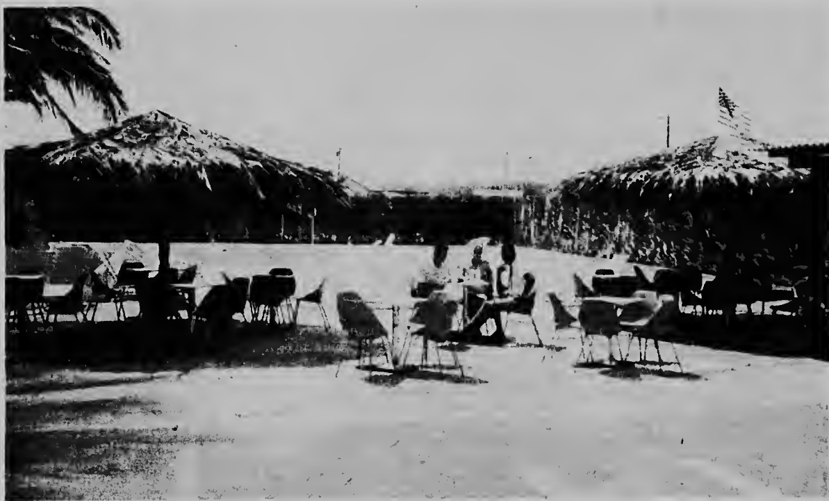
Un bista riba e espacioso "Sundeck Area" cu ta brinda oportunidad pa haci hopi cos ariba, manera balle, volleyball, banjo di solo, etc.

E principal candidato oposi- cionista Francois Mitterrand, ken- de e comunistanan a ofrece nan apoyo electoral, a bisa. "Bon ta cla, De Gaulle a selec- cion e mihor candidato Degau- llista .... y puesto cu ainda e ta representa poder personal, lo mi combati De Gaulle".